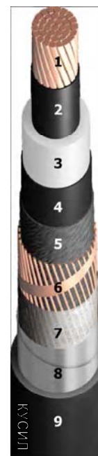
Рисунок 1 Пример конструкции кабеля КУСИЛ 1х185/25-35 ПвПг